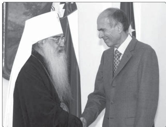
Встреча с Президентом Республики Словения доктором Янезом Дрновшеком

На следующий день, 28 июля, Патриарший Экзарх встретился с президентом Республики Словения доктором Янезом Дрновшеком. Глава Республики тепло приветствовал Владыку на словенской земле. В ходе беседы Президент высказал интерес к положению дел и устройству Белорусской Православной Церкви. В своем ответном слове Митрополит Филарет рассказал о Православной Церкви на белорусских землях, в частности, о белорусских духовных школах. Владыка Экзарх в свою очередь высказал благодарность д-ру Янезу Дрновшеку за радушный прием и организацию встречи. На память о посещении Митрополит Минский и Слуцкий Филарет преподнес в дар Президенту Я. Дрновшеку книгу «Путь служения» и журнал «Ступени». На встрече присутствовали представители кабинета Президента РС и посольства РФ в РС.