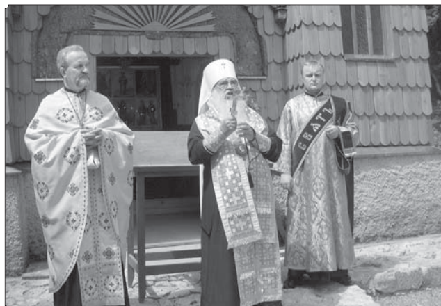
Божественная литургия в Русской часовне под Вршичем

В тот же день во второй половине дня на площади перед церковью в городе Краньска Гора состоялся концерт песнопений с участием словенского хора «Краньска гора» и хора МинДС. После концерта Патриарший Экзарх с делегацией РПЦ присутствовал на католической мессе, совершенной в память о погибших воинах. По окончании мессы хор МинДС пропел «Вечную память».