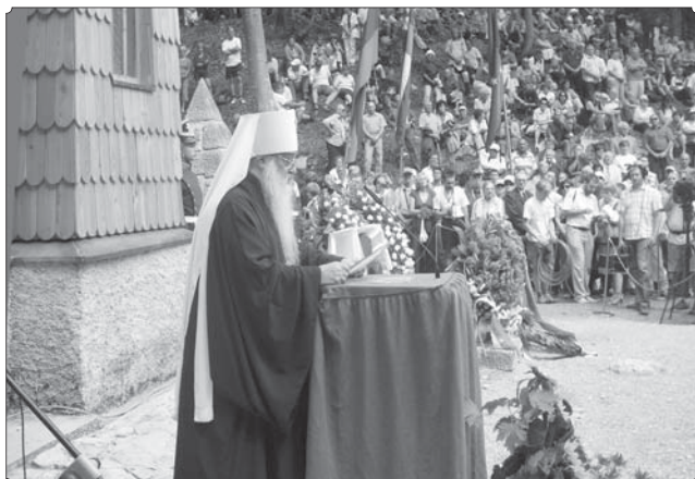
Выступление Патриаршего Экзарха на памятном событии

рога на перевал Вршич. После чего была начата мемориальная церемония. Перед несколькими сотнями людей, собравшимися на памятном месте, выступили премьер-министр РС Янез Янша, председатель Совета Федерации Федерального Собрания РФ С.М. Миронов, мэр г. Краньска Гора Ю. Жерьява, председатель общества «Словения – Россия» С. Гержина. Почетные гости мероприятия возложили венки к памятному знаку, воздвигнутому на сем месте в память о русских воинах.